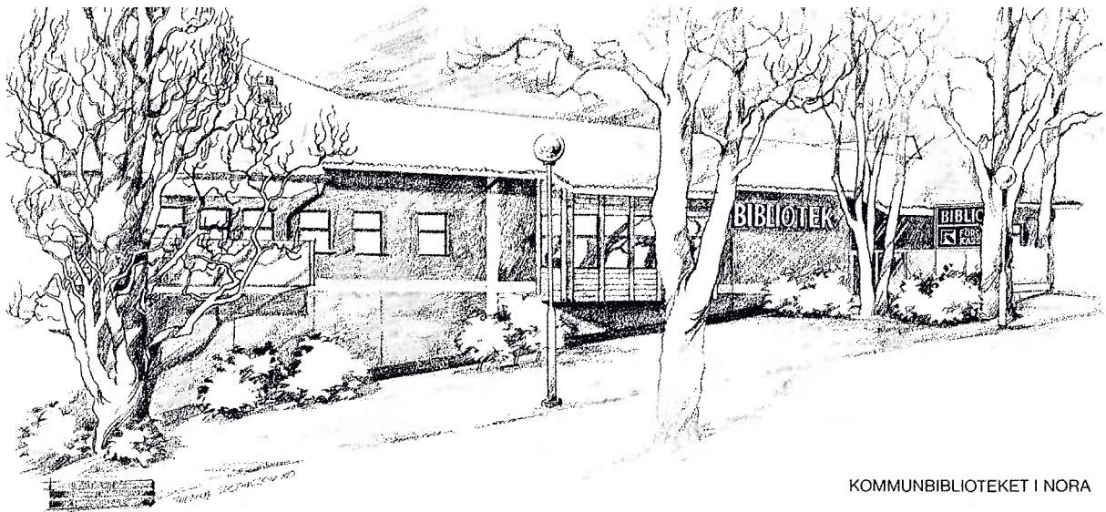
KOMMUNBIBLIOTEKET I NORA